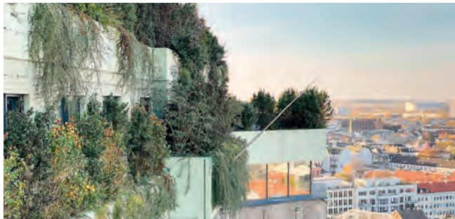
Grüner Bunker auf St. Pauli

Die Teilnahme an unseren Veranstaltungen erfolgt für Mitglieder und Nichtmitglieder auf eigene Gefahr. Der Verein übernimmt keinerlei Haftung.